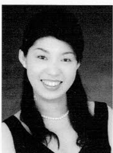
アルト 高原 いつか